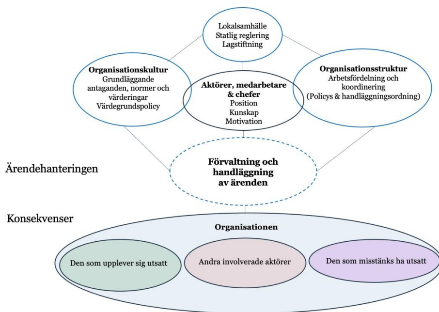
Figur 1. Organisationsteoretisk modell (egen).

Avslutningsvis, förutom att följa hur frågan vandrar i organisationen genom att belysa berörda aktörers erfarenheter, syftar föreliggande studie även till att utforska vilka konsekvenser ärendehantering har för den som upplever sig utsatt, andra involverade aktörer, den som misstänks ha utsatt samt för organisationen i stort. De empiriska resultaten i föreliggande rapport kommer belysa modellens olika delar.