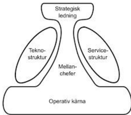
Figur 2. Organisationers fem delar (Mintzberg, 1993, s. 11).

De fem delarna kan ha olika omfattning och utförande beroende på verksamhet och skapar olika organisationsformer . Organisationsformer ger olika förutsättningar för att leda och styra verksamheten. Akademien skulle enligt Mintzbergs (2009, s. 23) teori definieras som en professionell byråkrati . Utmärkande för denna organisationsform är att personer i den operativa kärnan har en formell utbildning och ofta är specialister inom ett område. Organisationsformen kännetecknas också av att beslutfattandet är decentraliserat och sker baserat på medlemmarnas utbildning (profession), regler och normer. Den operativa kärnan är en central i denna organisationsform som strävar mot en koordinering och standardisering av kompetens (se figur 3). Till den operativa kärnan hör en relativt stor stödfunktion (servicestruktur i figur 2) vars centrala uppgift är att just stödja och hjälpa de professionella.